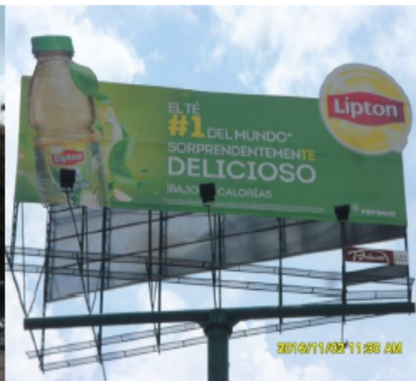
SENTIDO NORTE - SUR DE LA VALLA TUBULAR